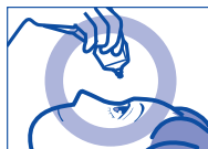
容器の先を下に向けて点眼