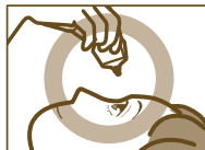
容器の先を下に向けて点眼